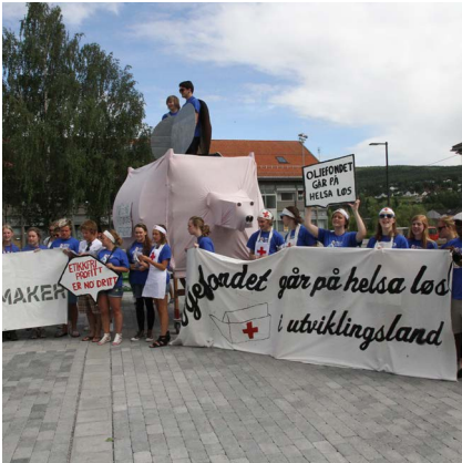
2012: Sommersnu-aksjon for et etisk oljefond, med "verdens største sparegris".