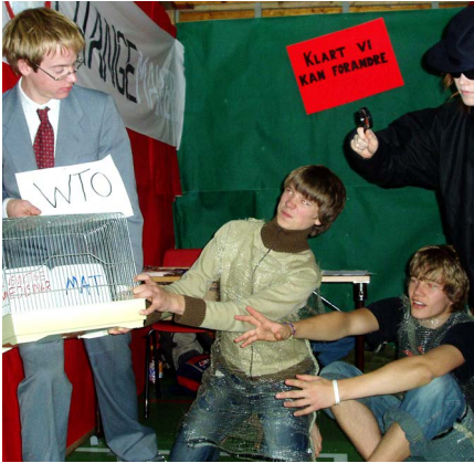
2005: Lokalgruppeaksjon i Stryn i forbindelse med Patent-TRIPS-kampanjen.