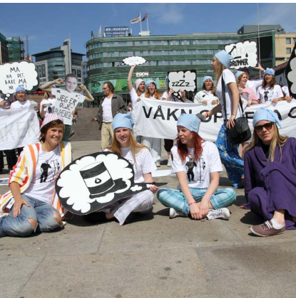
2010: Aksjonister ber politikerne "våkne opp fra oljedrømmen".