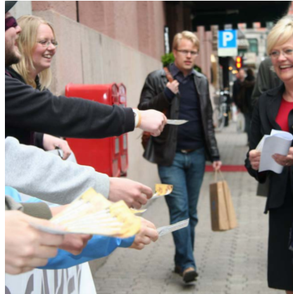
2006: Changemakere overrekker krav om klimavennlige investeringer til Kristin Halvorsen.