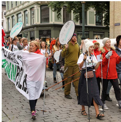
2015: Changemakere på ekspedisjon til Grønnpolen, aka lavutslippssamfunnet.