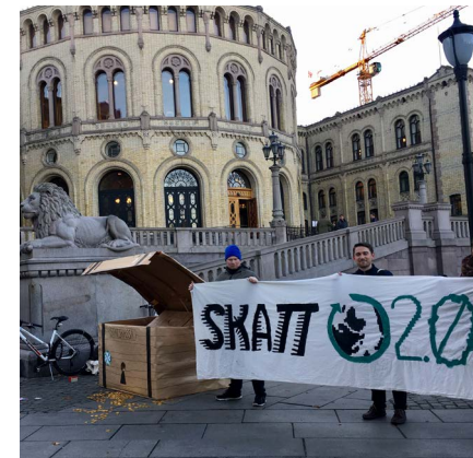
2017: Hovedtemakampanjen "Skatt 2.0": oppdater skattesystemet, tett smutthullene.

1996 Kampanje saman med Aksjon Slett U-landsgjelda, der Noreg vart fyrste land til å gjennomføre 100% gjeldsslette til utviklingsland