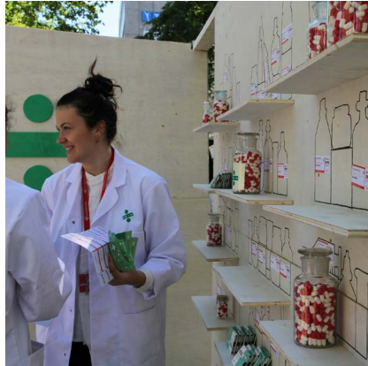
2016: Pop-up-o-tek på Youngstorget for å samle inn underskrifter mot patenter.