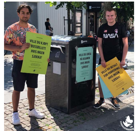
2019: Fra hovedtemakampanjen #hvisingensjekk for et mer etisk næringsliv.

1997 Bidro til etablering av Max Havelaar i Norge, og deretter til at slaget av FairTrade-varer har økt jevnt