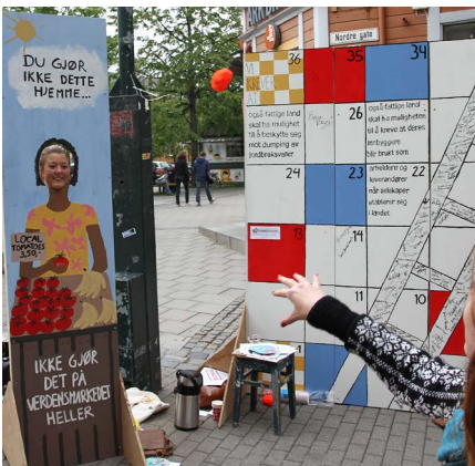
2012: Hovedtemakampanjen ba Norge ikke "dra opp stigen etter seg" i WTO-forhandlinger.