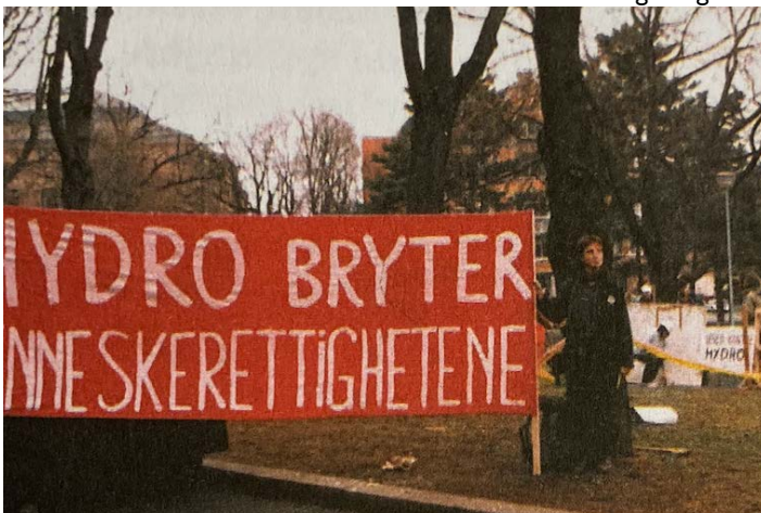
1998: Aksjon mot Norsk Hydro - les mer på side 20.