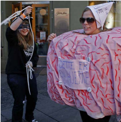
2008: Fra hovedtemakampanjen "Hjerneriveri". Changemaker forklarer kronprinsparet hvorfor Norge må slutte å aktivt rekruttere helsearbeidere fra fattigere land som trenger arbeidskraften selv.