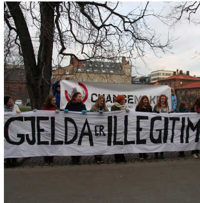
2008: Kampanjen "diktatorsko" - gjelda opptjent under diktatorer er illegitim.