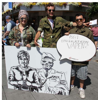
2014: Diktatorkappløp for kampanjen "Skal vi stanse?".

2003 Bidro med alliansebygging som hindret regjeringen i å støtte invasjonen av Irak