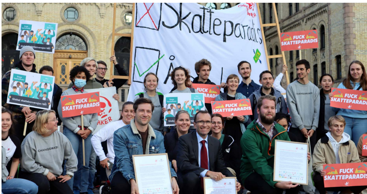
Aksjon utenfor Stortinget i september 2021, med krav om en global skattekonvensjon i FN.

Cayman Island er et ekstremt velorganisert samfunn. De er så velorganiserte og så skikkelige. Mye skikkeligere enn i Norge. Neida.