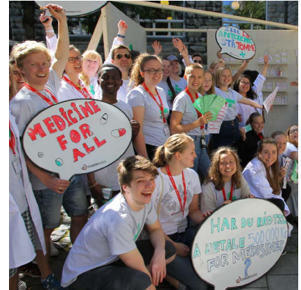
2016: Hovedtemakampanjen "Fritt for Medisin" - nei til patenter.

2001 Bidro til at Sør-Afrika fikk produsere billige kopimedisiner til sine aidssyke uten å bli saksøkt av legemiddelindustrien