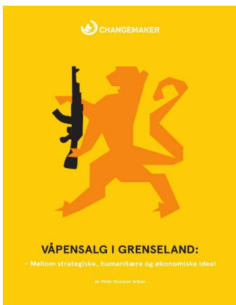
< Changemaker har også bidratt med rapporter. Her er rapporten Våpensalg i Grenseland som kom ut i 2018.