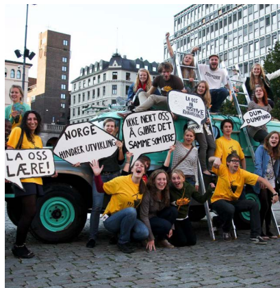
2012: "Ikke dra opp stigen"-kampanjen hadde også sin egen bil: Stigebilen Stig.