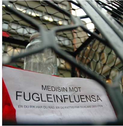
2005: Buraksjon mot TRIPS.