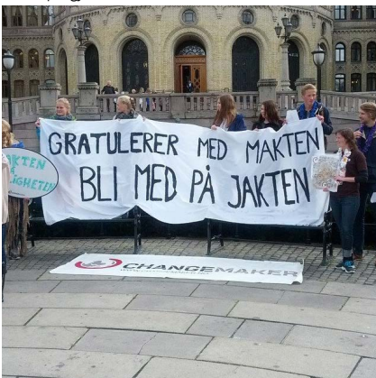
2013: Fra kampanjen "jakten på ærligheten" med krav om at Norge jobber for at selskaper slutter å stjele skatten fattige land har krav på, blant annet med utvidet land-for-land rapportering.