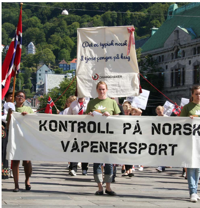
2009: Changemakere markerer motstand mot våpeneksport i 17.mai-toget