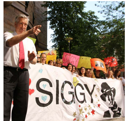
2012: Siggy-kampanjen hvor vi heide fram implementasjon av "land-for-land"-rapportering.