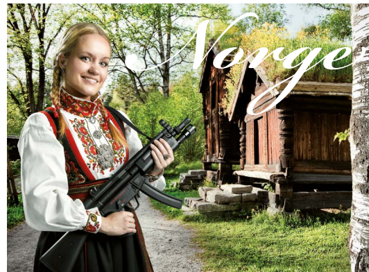
I 2009 hadde Changemaker vår første hovedtemakampanje om våpen. I “Det er typisk norsk å tjene penger på krig” brukte vi en vri på et gammelt ordtak for å rette søkelyset mot norsk eksport av våpen.