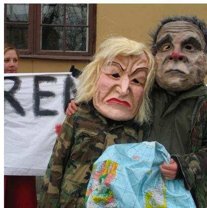
2004: Bilde fra aksjon mot Bush-doktrinen: Trenger verden flere kriger?