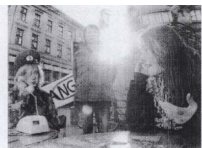
Aktivistene i Changemaker vil at forsvarsminister Kristin Krohn Devold skal tenke nytt om kampen mot terror.