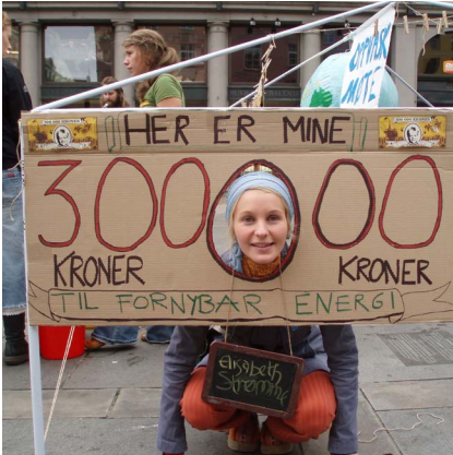
2006: Fra hovedtemakampanjen "klimavennlig oljefond".