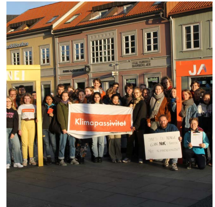
2019: Fra hovedtemakampanjen klimapassivitet. Syns du Norge gjør nok for klima?

1998 Ressursgruppen Forbruk og miljø ble opprettet