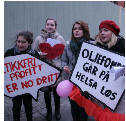
2012: Kampanjen "Etisk Oljefond" ba om at etikkrådet kan vedta uttrekk fra uetiske selskaper.