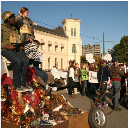
2008: Fra kampanjen "diktatorsko" som satte fokus på gjeld land har fått under diktatorer.