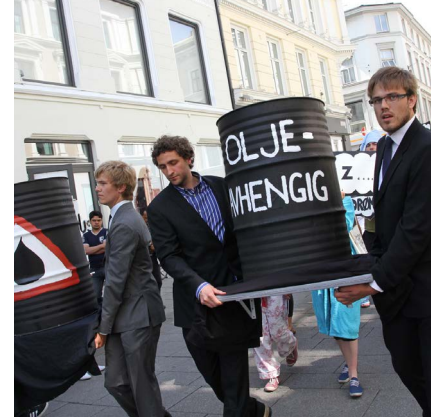
2010: Hovedtemakampanjen "Oljeavhengighet" som satte lys på klimakonsekvensene av olje.