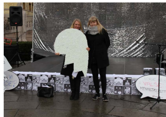
I kampanjen “Skal vi stanse” fra 2014 krevde Changemaker en stopp i eksport av våpen til diktaturer. Her med nåværende utenriksminister Anniken Huitfeldt - vi håper hun vil sørge for bedre kontroll på våpeneksporten i fremtiden.