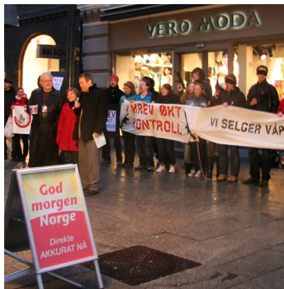
2008: Changemakere snakker om våpeneksportkontroll på God Morgen Norge.