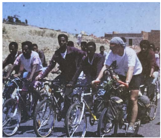
1993: 8 ungdommer sykler Kapp til Kapp med ønske om å lære mer om verden - og startet Changemaker når de kom hjem

Selv om det hele startet som et innsamlingsinitiativ var det alltid en visjon om at Changemaker skulle bli en bevegelse for unge aktivister. For å promotere Changemaker ble Skjærgårdsgospel en viktig arena. Dette var allerede et veletablert samarbeid med Erling Borgen