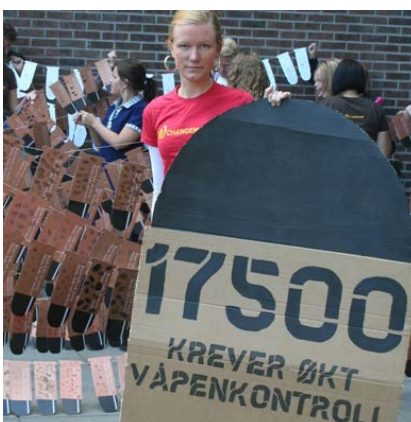
2009: Fra kampanjen "Det er typisk norsk å tjene penger på krig".