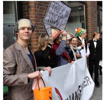
2012: Changemakere har kledd seg ut for Halloween for "Trick or Treaty?"-aksjon.