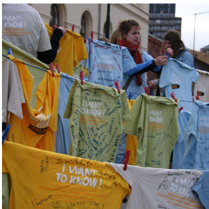
2007: Fra kampanjen "who takes the bullet?" med krav om sluttbrukererklæring for våpeneksport.